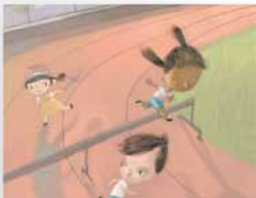
Ilustración: Paula Andrea Ortiz

En síntesis, lo que se busca es construir colectivamente una comunidad de aprendizaje basada en los principios de la RAP, con capacidad para multiplicar e instalar en las instituciones educativas la estrategia pedagógica y la visión propuesta de Educación para la Ciudadanía y la Convivencia.