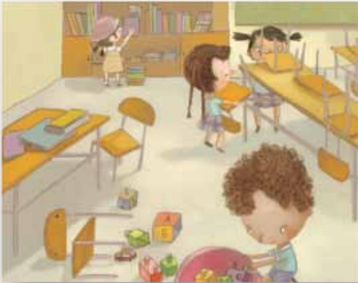
Ilustración: Paula Andrea Ortiz

En consonancia con estos derroteros (Principios y Momentos Pedagógicos + Capacidades ciudadanas), la estrategia de Gestión del Conocimiento ha diseñado una Ruta de Aprendizajes Ciudadanos -organizada de acuerdo a la Reestructuración Curricular por Ciclos- compuesta de seis mallas, que van desde el ciclo inicial al ciclo cinco, y que sirven como indicadores del desarrollo de las seis capacidades ciudadanas esenciales.