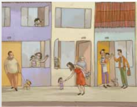
Ilustración: Paula Andrea Ortiz

La Red de Recursos y Herramientas busca procurar múltiples recursos y estrategias pedagógicas para la “formación-acción” de ciudadanos y ciudadanas, para el desarrollo de las capacidades ciudadanas esenciales desde la creatividad y con miras a la transformación de realidades en comunidades escolares y barriales.