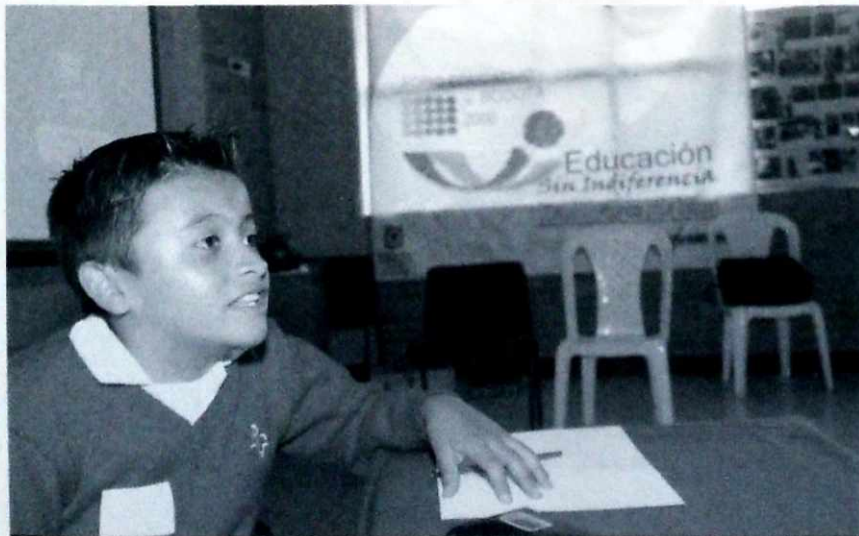
Una voz, una propuesta, una acción.

De la misma manera, se vienen desarrollando diversas formas de organización educativa en las localidades, lideradas en su mayoría por las instituciones educativas, entre las cuales se encuentran: Los comités que adelantan proyectos específicos, como atención a estudiantes con necesidades especiales o comités locales de emergencia; los convenios interinstitucionales que desarrollan propuestas de investigación pedagógica, capacitación docente y proyectos conjuntos; los Consejos Asesores de Política Educativa Local-CAPEL; las Mesas Locales de Participación: ambiental, padres y madres, jóvenes, rectores, entre otras; las Redes, organizadas para fortalecer determinadas instancias de la comunidad educativa, áreas específicas de conocimiento y el desarrollo de temáticas prioritarias para garantizar una educación