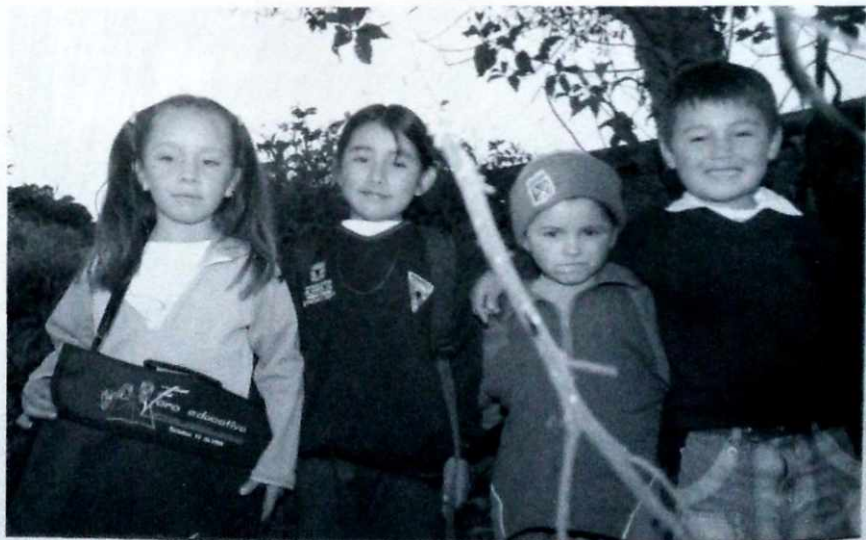
Por una educación al alcance de los más pequeños.

Sin lugar a dudas, este fue uno de los programas menos desarrollados en las diferentes localidades, por ello se sugirió desarrollar y reforzar el programa de bilingüismo con cobertura en todos los niveles de la educación formal, privilegiando la formación de docentes; establecer convenios interregionales para intercambiar experiencias y desarrollar proyectos de investigación.