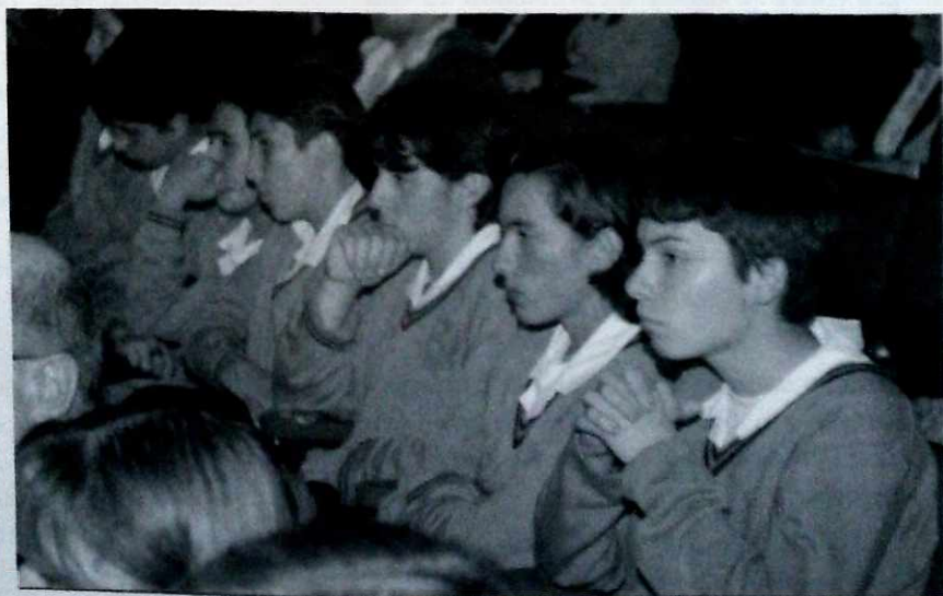
Los jóvenes escuchan y reflexionan sobre los procesos educativos.