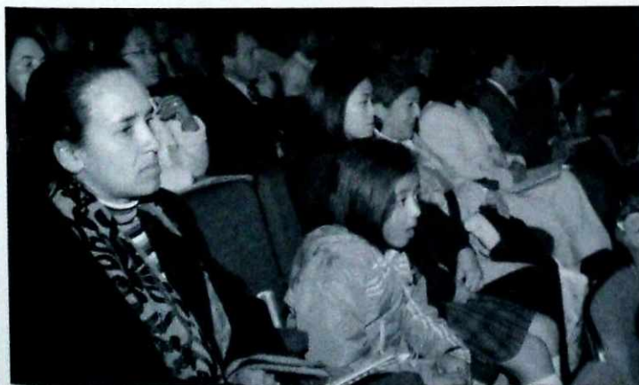
El manejo del tiempo libre, un interés central en el proyecto educativo del Distrito.