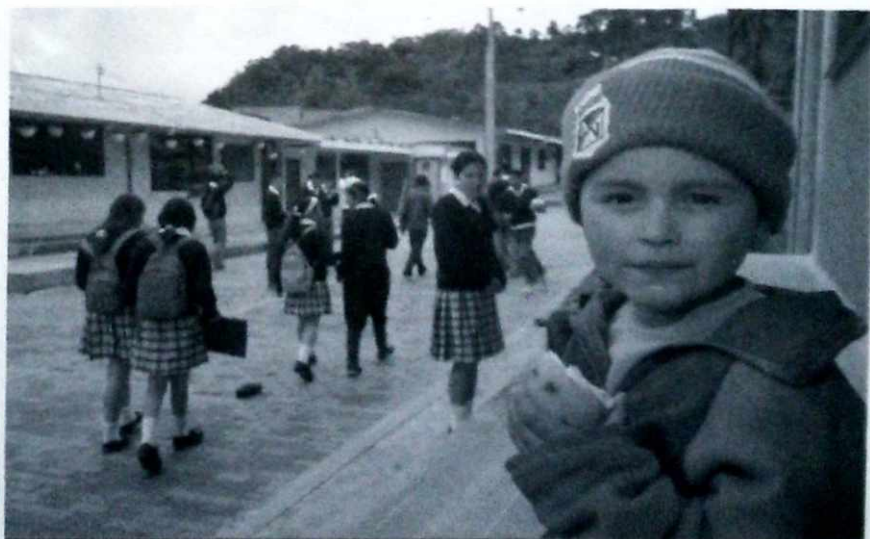
Educando para participar.