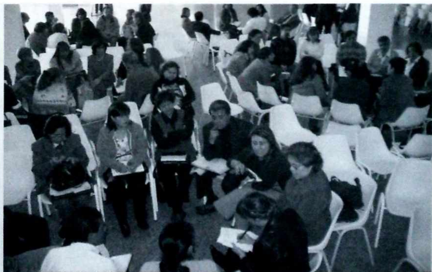
Discusiones amplias y profundas en los foros locales.

Todas las localidades participaron en expediciones pedagógicas a distintos escenarios (planetario, bibliotecas, museos, además de otros) que despertaron el interés por el conocimiento, el desarrollo de estrategias donde la ciudad se convierte en escenario de aprendizaje y el mejoramiento en las relaciones de convivencia, con la participación de 1'813.719 estudiantes. Sin embargo no todas las instituciones educativas precisaron la articulación de estas expediciones con proyectos de área, asignatura o aula. Algunas localidades mencionaron el desarrollo de proyectos de acompañamiento de estudiantes en tiempo extraescolar, pero se señaló que la cobertura fue