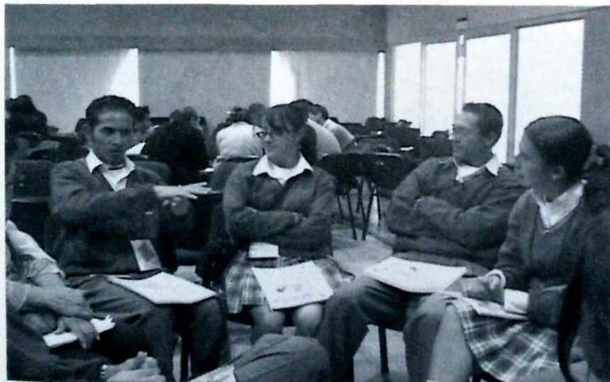
En busca de una política pública para jóvenes.

En cuanto a las aulas especializadas y la rotación de grupos: mayor dotación de aulas de tecnología e informática, con Internet para el aprovechamiento pedagógico de la REDP; ampliación y fomento del uso de la Red Distrital de Bibliotecas. En la mayoría de las instituciones hacen falta aulas especializadas y a las que existen, hay que dotarlas adecuadamente con recursos humanos y físicos; fortalecimiento de las REDES, para que posibiliten la modernización de la enseñanza y