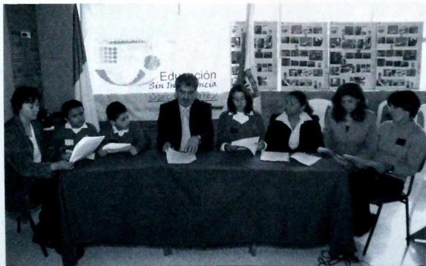
Representantes de todos los sectores de la comunidad educativa participan en los foros locales.