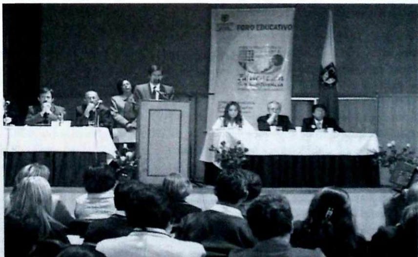
Los Foros locales permitieron la participación de amplios sectores de la comunidad educativa.