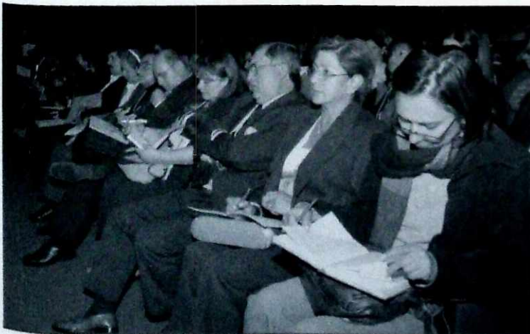
Se requiere fortalecer los escenarios de movilización social para la educación.

Inició su intervención haciendo un llamado a entender la dimensión y trascendencia de los Foros Locales como espacios organizativos, participativos y de decisión donde los miembros de las comunidades educativas tienen la oportunidad de dialogar en torno a sus problemáticas, reivindicaciones y propuestas que inquietan el mundo escolar.