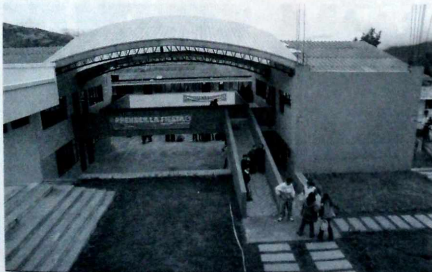
Nueva infraestructura física para enfrentar nuevos desafíos.

Estos ejes temáticos permitieron hacer evidentes las dinámicas locales en participación, organización e incidencia en las políticas educativas a partir de dos referentes, el Plan Sectorial de Educación: "Bogotá una Gran Escuela" —2004-2008 y la proyección de un Plan Decenal Educativo.