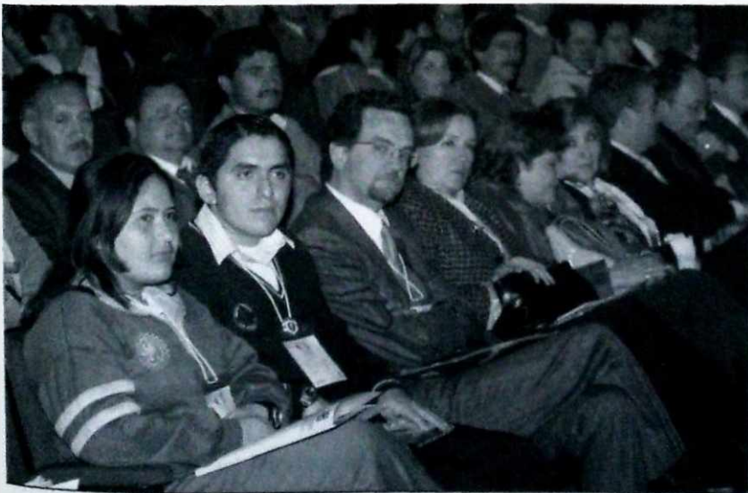
Los miembros de la comunidad educativa se integran en redes locales por la educación.

Se han adelantado procesos de participación, por ejemplo, desde el Consejo de Bogotá generando acuerdos para crear el Comité de Seguridad Escolar, el Comité de Atención de Emergencias, El Comité de Reforzamiento, el Comité de Desplazamiento, el Comité de Jueces de Paz y el Comité de Mediadores.