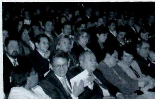
Avanza en el Distrito la red maestros investigadores.