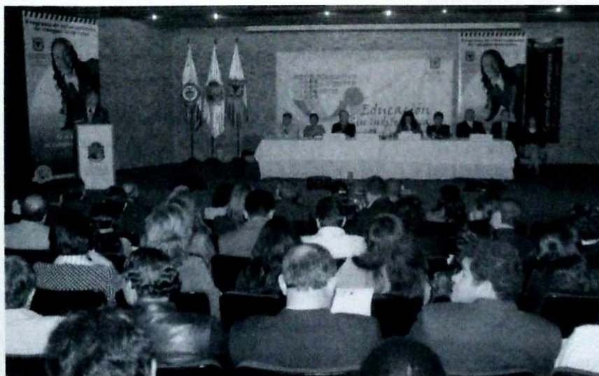
Ampliación de la oferta educativa, eje central de la política educativa.

De igual manera, para garantizar el acceso y la permanencia y apostarle a una más alta calidad, está en ejecución el más ambicioso programa de construcción y mejoramiento de establecimientos escolares de que se tenga noticia. Dicho programa incluye 38 colegios completamente nuevos, 12 también nuevos para reposición, 201 reforzamientos estructurales, más de 50 ampliaciones y 363 obras menores de mejoramiento, son las metas del programa que aspiramos a dejar totalmente terminado, si las condiciones nos lo permiten. En los primeros 6 meses del próximo año deben estar terminados y en funcionamiento 30 nuevos colegios, los 13 restantes deberán estarlo