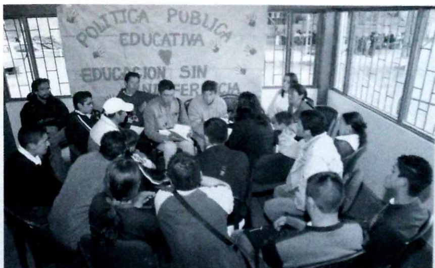
La educación: una construcción colectiva en la Localidad de Sumapaz.