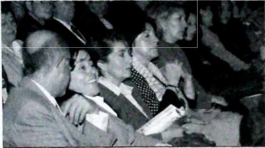
Fortalecer la red de derechos humanos, un propósito en el Distrito.

metas en conjunto para la atención de problemáticas locales.