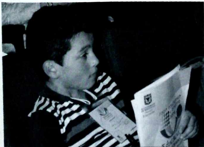
Ampliar la cobertura de Escuela-Ciudad-Escuela, un propósito para el 2007.