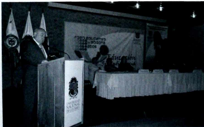
Instalación del Foro 2006 por parte del Secretario de Educación del Distrito.

Para avanzar hacia unos nuevos desafíos educativos, la ciudad tiene que decidirse de manera resuelta a consolidar y profundizar la nueva política educativa que esta administración ha puesto