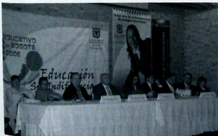
Bogotá, debe garantizar la universalización de la cobertura educativa.