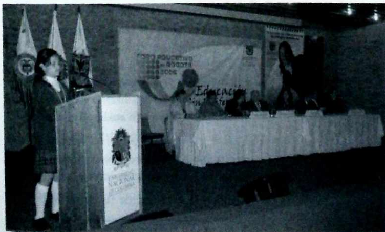
Los jóvenes, los más escuchados en el Foro Distrital 2006.

En términos generales, la participación del Foro estuvo enfocada en dos aspectos comunes en las propuestas de los participantes de las diferentes mesas temáticas: Primero, la continuidad de los programas y proyectos de la política educativa del actual gobierno distrital. Y, segundo, una mirada a largo plazo sobre la calidad de la educación, en donde los PEI y el gobierno escolar sean la materialización de la educación pública. Temas como la articulación con la educación superior y el sector productivo, el mejoramiento y especialización de los maestros y maestras, la actualización de los currículos y la democratización