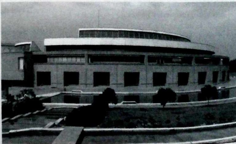
Biblioteca Virgilio Barco.

Otorgado por la Organización Mundial de la Salud (Bruselas, 2002) por los avances