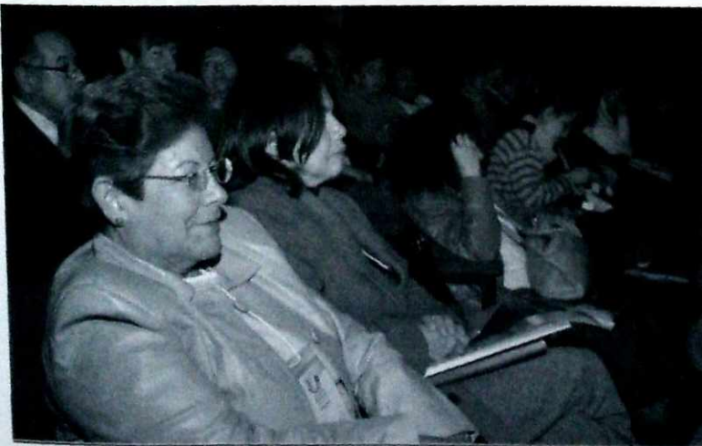
La participación, mecanismo privilegiado para concertar.