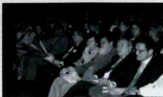
Educar a los adultos es parte de la propuesta de educación en el Distrito.