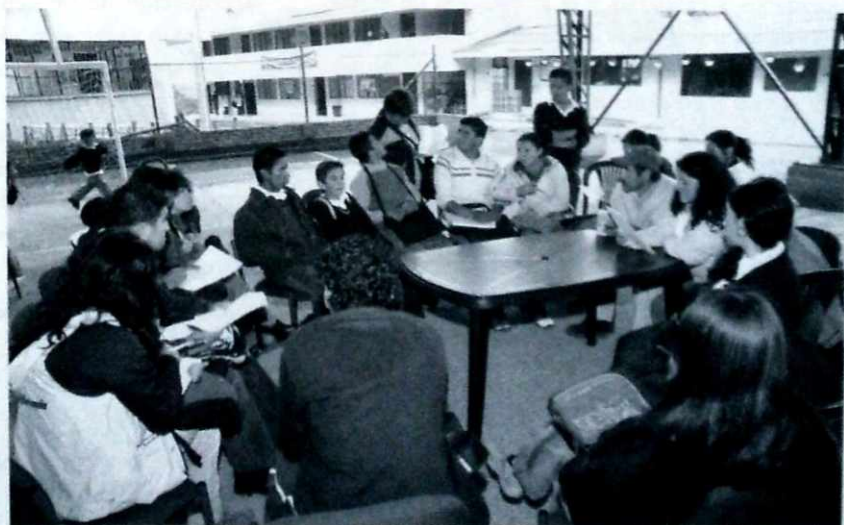
Jóvenes comprometidos con una educación sin indiferencia.