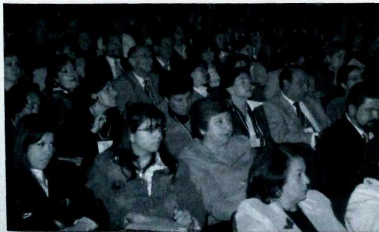
Bogotá avanza en la búsqueda de modelos educativos que articulen trabajo y formación.

La transformación del rol del maestro en función de los nuevos esquemas de comunicación que