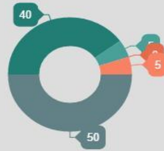
Facilitadores por Estamento

En sus inicios, el equipo dinamizador del Colegio estuvo compuesto por las docentes que inscribieron y sacaron adelante la única Incitar que inscribió el Colegio. En esos primeros meses, también fue importante el trabajo de acompañamiento que se hizo con el Consejo Estudiantil del año 2014, el cual permitió que la comunidad carrancista conociera, con hechos, las apuestas y las estrategias del PIECC. Más adelante, con el ejercicio de revisión participativa que lideró el PIECC, también se fueron sumando más facilitadores al Equipo Motor. Actualmente, el equipo dinamizador está compuesto por las y los docentes de Ciencias Sociales y de Gestión Social y Comunitaria (el énfasis del Colegio), el Consejo Estudiantil Unificado y el Comité de Convivencia.