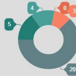
Facilitadores por Estamento