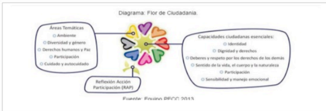
Diagrama: Flor de Ciudadanía.

La propuesta conceptual, integral y contextualizada del PECC, articula diversos pedagógicos, áreas temáticas y actores facilitadores, sustentada desde la SED en la pedagogía crítica, el desarrollo humano a partir de seis capacidades ciudadanas esenciales, apoyado en un método pedagógico centrado en la reflexión, acción, participación –RAP-. De esta forma, se estructuran estrategias interrelacionadas y dinámicas como son: Gestión del Conocimiento, Iniciativas Ciudadanas de Transformación de la Realidad –INCITAR-, y Respuesta Integral de Orientación Escolar –RIO-; enfocadas al logro de la integración curricular de la ciudadanía, el empoderamiento y la movilización de los actores facilitadores de ciudadanía y la construcción de convivencia y relaciones armónicas en la escuela y su entorno. Estas estrategias se integran en la construcción de los Planes Integrales de Educación para la Ciudadanía y la Convivencia –PIECC-.