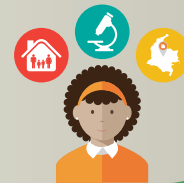
ESQUEMA 1. Elementos que sustentan el desarrollo de la ciudadanía a partir de las Ciencias Naturales