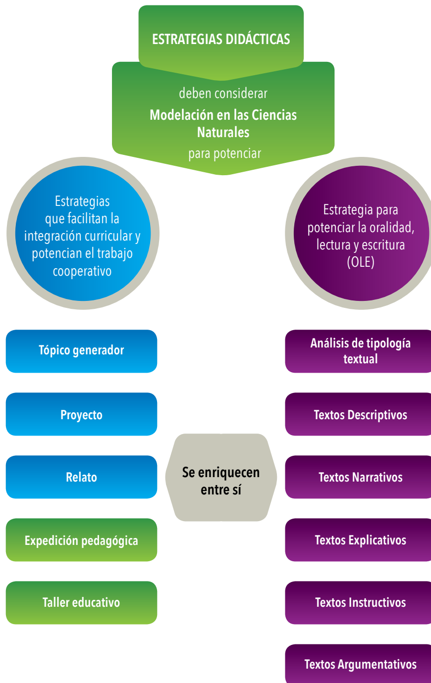
ESQUEMA 7. Estrategias didácticas en Ciencias Naturales