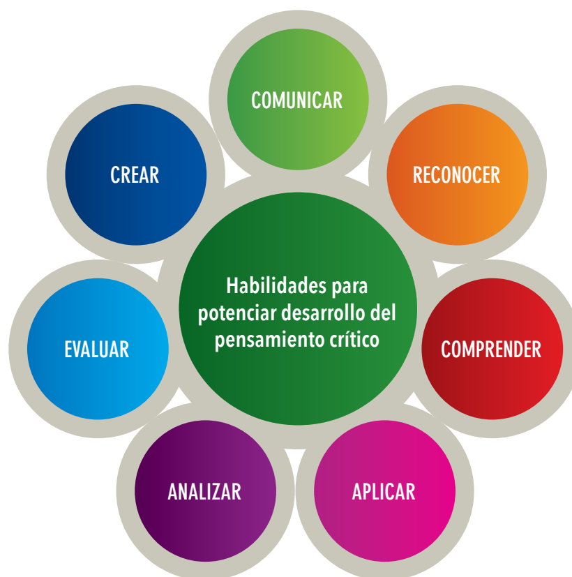
ESQUEMA 6. Habilidades para potenciar el pensamiento crítico

Se dice que el pensamiento crítico 34 es un proceso disciplinado intelectualmente que implica conceptualizar, aplicar, analizar, sintetizar y evaluar información, proceso que permite a las personas llegar a conclusiones y soluciones razonadas en aras de contribuir a la solución de problemas en su entorno para vivir en armonía. De aquí que sea pertinente el trabajo en el desarrollo de habilidades de pensamiento en los y las estudiantes así como lo propone Anderson y Krathwohl 35 , dado que este modelo en su conjunto contempla las habilidades propias de un pensador crítico. Es preciso resaltar que estos referentes pueden ser incorporados en la formulación de estrategias didácticas, pero requieren ser complejizados ciclo a ciclo; también es importante aclarar que el desarrollo de estas habilidades no requiere esquemas rígidos para potenciarlas sino que pueden consolidarse en entornos cotidianos problemáticos.