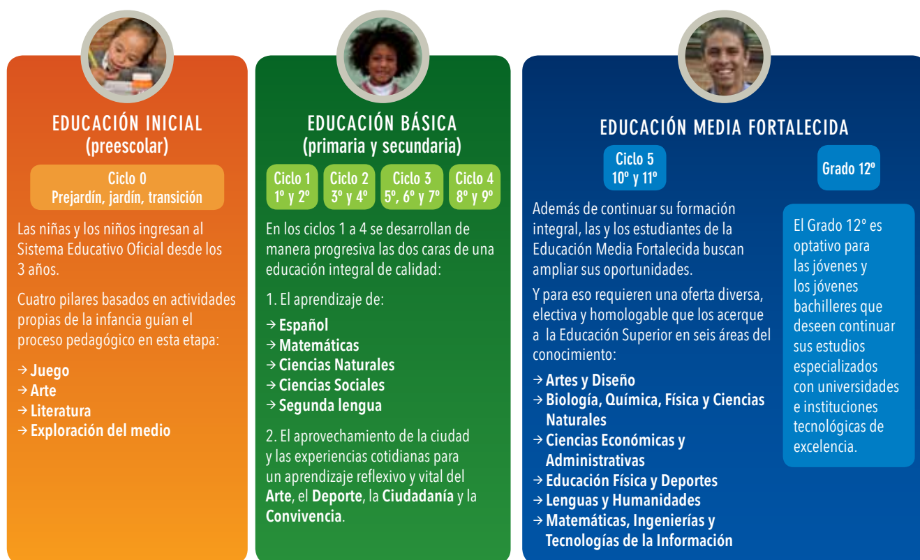
ILUSTRACIÓN 1. Aprendizajes potenciados en el currículo para la excelencia académica y la formación integral 22

En la ruta trazada por el currículo para la excelencia, las Ciencias Naturales deben potenciar estos grandes aprendizajes a partir de la interrelación y puesta en diálogo de núcleos temáticos, aprendizajes esenciales para el buen vivir y de situaciones problémicas que involucren preguntas potenciadoras y desarrollen el pensamiento crítico. Las líneas generales de estos aspectos se esbozan a continuación.