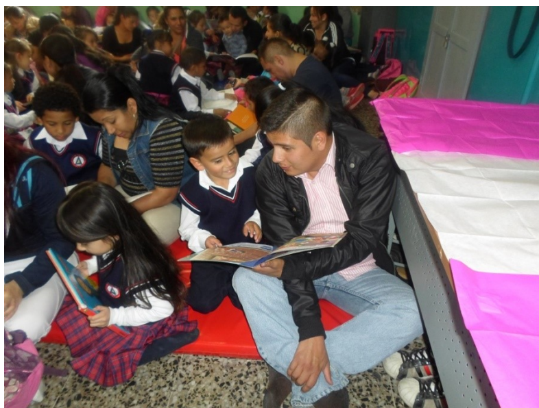
Foto 5 Padres del Colegio San Francisco. Fase de ejecución del proyecto Padres como mediadores de lectura en voz alta.