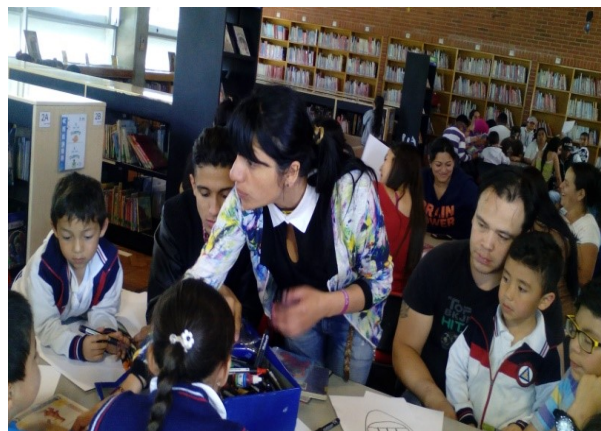
Foto 7. Promotora de lectura de la Biblioteca Gabriel García.