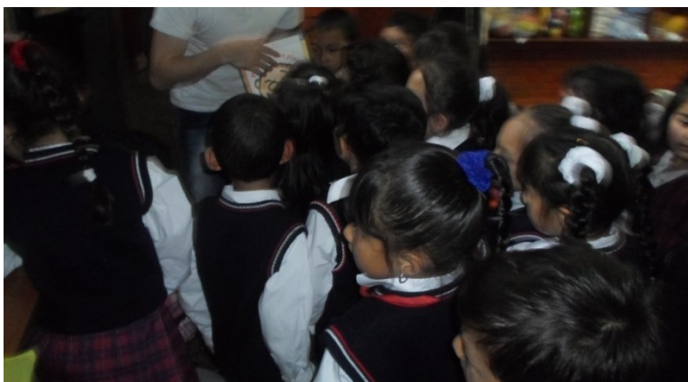
Foto 4 Estudiante de grado preescolar, Durante la fase de ejecución del proyecto de aula padres como mediadores de lectura en voz alta.

Mencionaremos como cada actor interviene en la fase de exploración, planificación, ejecución y evaluación del proyecto de aula denominado “Padres como Mediadores de la lectura en voz alta”.