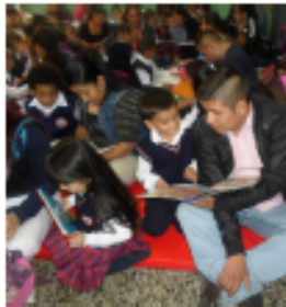
PADRES, ACUDIEN- TES Y NI- ÑOS DEL COLEGIO SAN FRAN- CISCO EN LA ACTIVI- DAD DE LEER EN VOZ ALTA.

“Junto con la escuela, el núcleo familiar es el principal agente mediador entre la infancia y los libros.”