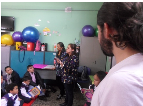
Foto 6. Maestras leyendo en voz alta durante la fase de ejecución.