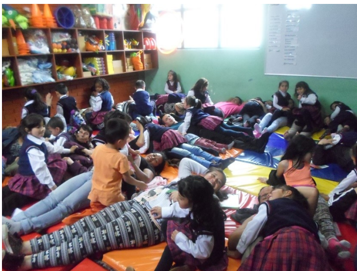
Foto 2. Fase de Ejecución. Padres y estudiantes del colegio San Francisco en la actividad del taller 1.

En la fase de la ejecución se tiene en cuenta el trabajo en equipo y la interdisciplinariedad logrando el aprendizaje autónomo, el conflicto, el desacuerdo pero con responsabilidad y respeto a la diferencia. En esta fase se desarrolla el proyecto. En esta etapa es importante la motivación que se brinde o exprese a los padres y madres como principales agentes participes en el proyecto. Se debe brindar claridad en lo que se planeó para que el tiempo que ellos dediquen en venir al colegio sea fructífero y enriquecedor para todos.