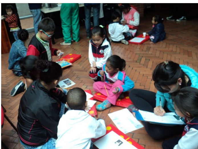
Foto 3. Estudiantes del grado Preescolar Fase de Evaluación del proyecto de aula “Padres como mediadores de lectura en voz alta”.

La evaluación es colectiva; padres, maestros, estudiantes con criterios claros para realizar una coevaluación, autoevaluación y finaliza con la evaluación del maestro. Es el momento para compartir y reflexionar sobre lo que se hizo en todo el tiempo de intervención del proyecto, en este punto debemos evaluar si la estrategia que se aplica tuvo algún tipo de efecto para acercar a los padres a la escuela, si los formamos como mediadores de lectura en voz alta y se generó algún tipo de vínculo.