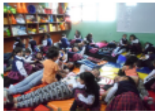
PADRES Y NIÑOS DEL COLEGIO SAN FRANCISCO

LO MÁS IMPORTANTE QUE PODEMOS HACER COMO PADRES ES LEER CON NUESTROS HIJOS DESDE UN PRINCIPIO Y CON FRECUENCIA. LA LECTURA ES EL CAMINO SEGURO HACIA EL ÉXITO EN LA ESCUELA Y EN LA VIDA. CUANDO LOS NIÑOS APRENDEN A AMAR LOS LIBROS,