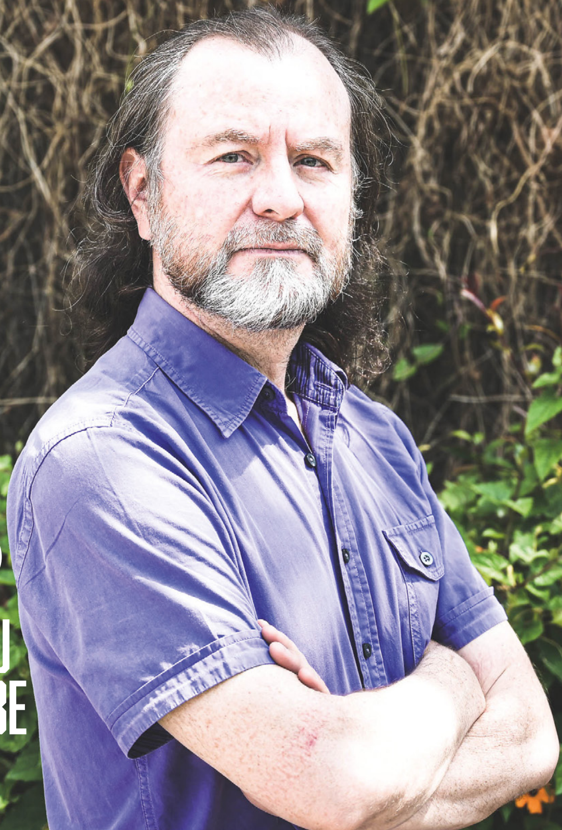
tomada en el Colegio Antonio Baraya el 7 de mayo de 2021.