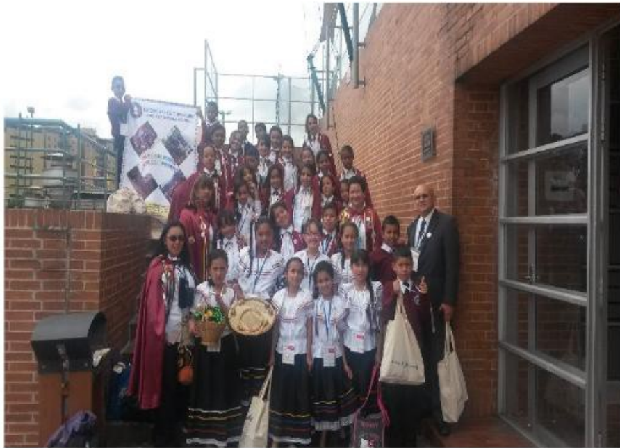
Imagen Foro Feria Distrital 2015