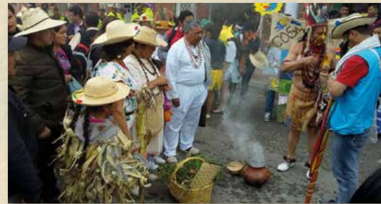
Ritual del Festival de la Chicha y el Maíz

¡El viento y el otoño se han llevado mi poesía, bailan las hojas del pueblo! ¿Dónde están mis raíces?