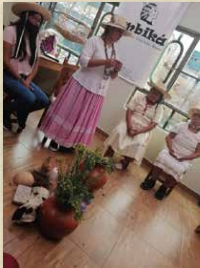
Mujeres Pijao en ritual de ofrenda.