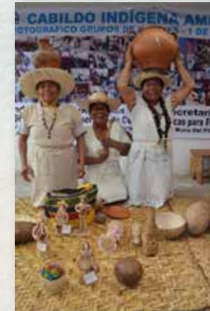
Mujeres Sabedoras Alimento propio Festival de la Chicha y el Maíz

Son utilizadas para armonizar los espacios, el cuerpo, el alma y el espíritu, según el desequilibrio, arrayán, cedrón, yerbabuena, manzanilla, albahaca de castilla, orégano, pringamosa, ruda, toronjil, mastranto y pelá.