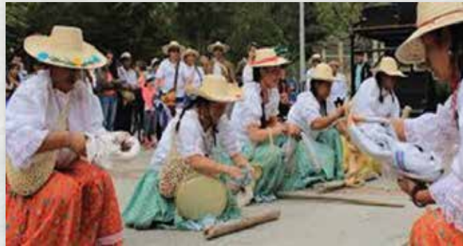
Fuente Archivo propio Cabildo Ambiká etnia Pijao (2020). Mujeres Pijao Danzando.