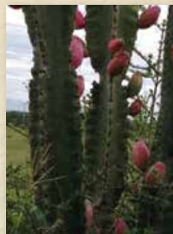
Fuente Archivo Propio Cabildo Ambiká etnia Pijao (2020). Tuna, alimento tradicional.

¡Kaike Manai Guipas y Guámbitos! El día de hoy les voy a explicar eué es el chiri - chajuá y su relación con la salud y enfermedad.