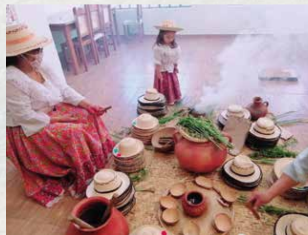
Mayora Pijao enseñando a mujeres de la comunidad como se realiza ritual propio.