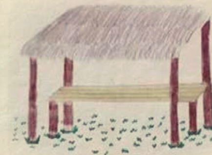
Representación de la Enramada.

Los lugares sagrados son la enramada y barbacoa, donde nuestros Tatas señores y padres cuentan historias de las raíces Pijao, dan a conocer los alimentos propios la Tuna (alimento que consumían nuestros antepasados guerreros), Maíz (alimento donde se obtiene la bebida sagrada chicha) y los instrumentos musicales utilizados en diferentes rituales o armonizaciones a través de la tradición oral.