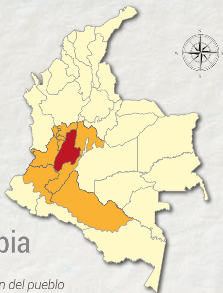
Mapa 1. Ubicación del pueblo Ambiká etnia Pijao en el país 2020.

(Capera Gratiniano sabedor de la comunidad Indígena Ambiká etnia Pijao, 2020).