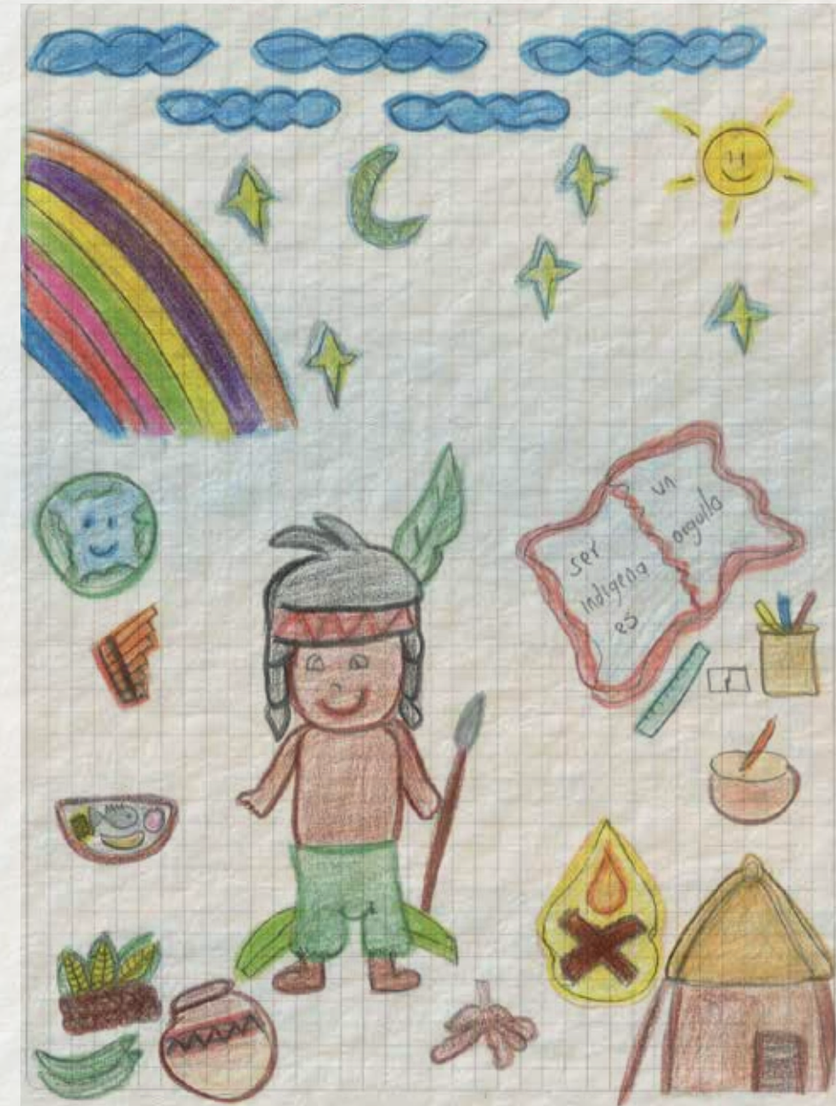
Yeins Alejandro Mateus Molano niño del pueblo Ambiká Pijao (2020). Ilustración de elementos identitarios del pueblo Ambiká Pijao.