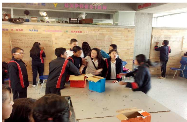
Anexo 6. Fotografía. Proyecto de aula. Muestra actividad No. 3. La caja misteriosa