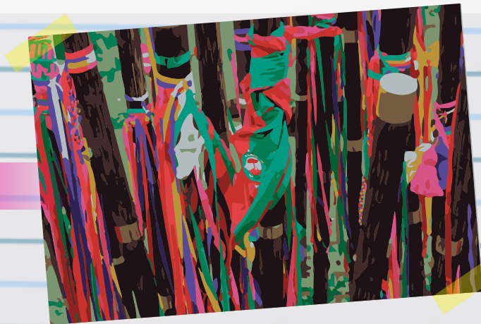
Bastones de mando / Organización de Indígenas del Cauca

El núcleo de la política de educación para la ciudadanía y la convivencia que la Secretaría de Educación del Distrito viene desarrollando desde el 2012 tiene que ver con el fortalecimiento de las capacidades ciudadanas, que “están enfocadas al crecimiento del ser, a la construcción de un saber en contexto, y al hacer, como herramienta por excelencia de la transformación social”. Estas abogan por la formación de sujetos críticos, empoderados e imaginativos, que puedan participar de manera responsable y autónoma en el diseño de sus proyectos vitales, y contribuir a la construcción de la paz, la justicia y la democracia en distintos escenarios de la sociedad. En últimas, es una educación de calidad que integra conocimientos académicos con capacidades ciudadanas para un buen vivir en las comunidades educativas.