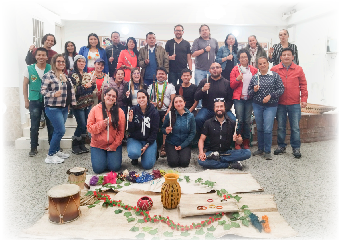
Imagen 16. Cárdenas, A. 2022. Cierre de Estancia con el Pueblo Wounaan.

Para finalizar el encuentro todas las autoridades del cabildo entregaron a cada uno de los participantes manillas tejidas artesanalmente y bastones de mando de madera, como recuerdo y compromiso de todo lo enseñado en la estancia. Se enfatiza en la hermandad y el compromiso con la madre tierra y el compromiso indígena aquí en Bogotá.