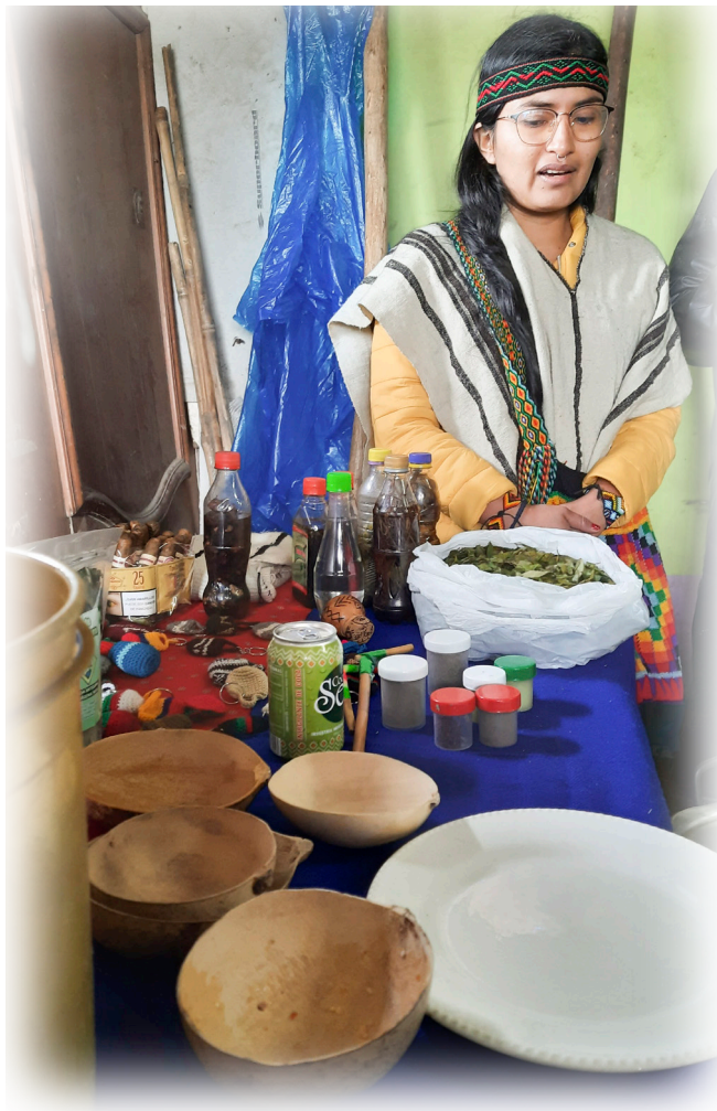
Imagen 6. Díaz.J 2022, Sabedora y medicina propia.

El pueblo Nasa cuenta con medicina propia que es desarrollada por el thewala (médico tradicional), quien es el que cuenta con el conocimiento para armonizar física y espiritualmente a quien lo necesite.