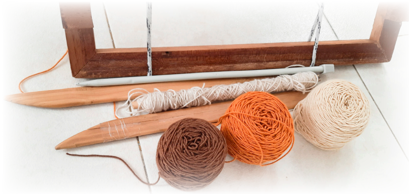
Imagen 34. Díaz,J. 2022. Lanas del tejido.