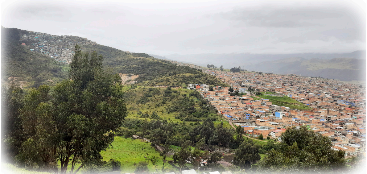
Imagen 2. Díaz.J 2022, panorámica Localidad de Usme.