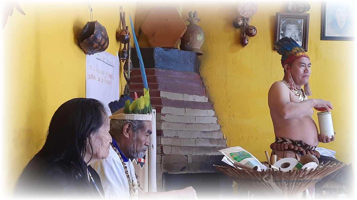
Imagen 24. Díaz.J 2022. Los abuelos.