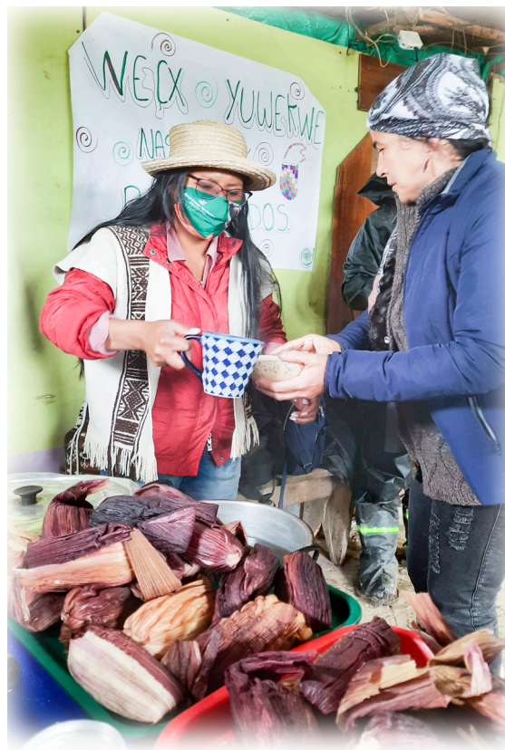
Imagen 8. Díaz, J. 2022, Compartir el alimento.

El alimento para la comunidad Nasa es fundamental. En el encuentro se compartieron en la mañana envueltos de maíz tierno, huevos pericos y agua de panela caliente con canela; y para el almuerzo, mute de gallina preparado con frijol verde, maíz perlado, coliceros, yuca, ahuyama, arracacha, cilantro, aguacate y gallinas de campo acompañado de ají y chicha de caña dulce, esta es una bebida tradicional que da energía y que se comparte en ocasiones especiales como las bodas o las festividades propias y momentos de minga.