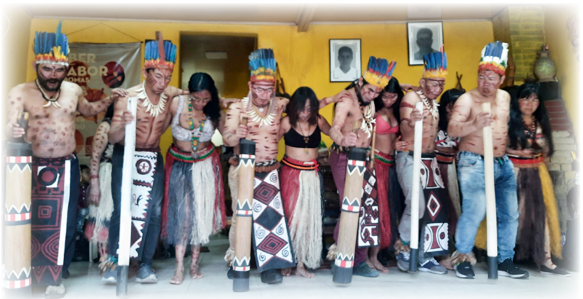
Imagen 28. Cárdenas, A. 2022. Danza ritual Tubú.