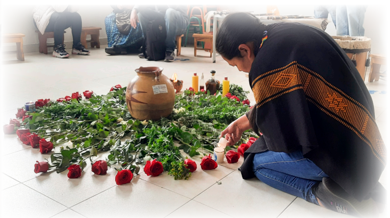
Imagen 37. Cárdenas, A. 2022. Tejido Pasto.