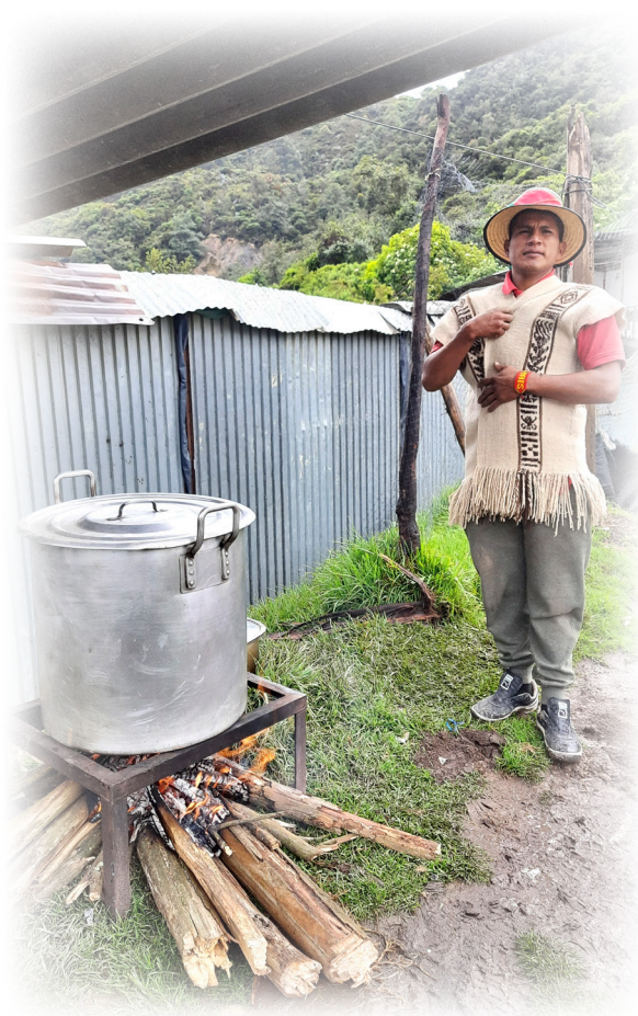
Imagen 1. Díaz.J 2022, Bienvenida a la estancia.

Su economía se basa en la agricultura y en la posesión de rebaños de ovejas, siendo las mujeres las encargadas de su cuidado.