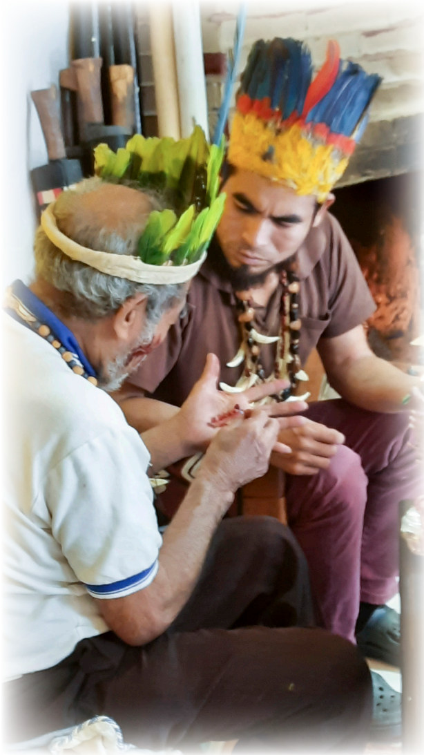
Imagen 30. Cárdenas, A. 2022. El abuelo enseñando símbolos.