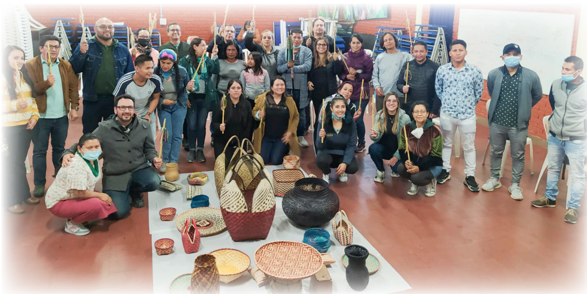
Imagen 23. Pueblo Eperãra Siapidara. 2022. Cierre de Estancia.