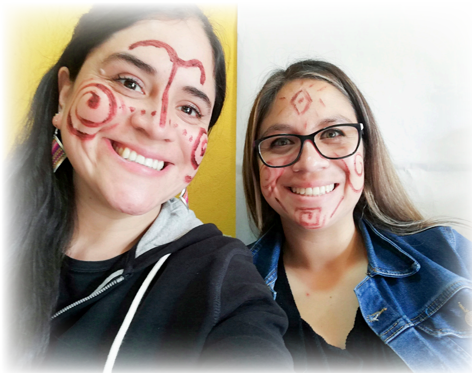
Imagen 26. Pueblo Tubú. 2022. Pintura Corporal con Símbolos Propios.