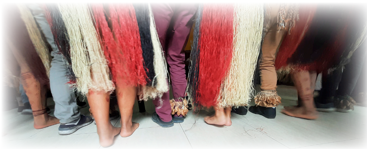
Imagen 27. Díaz.J 2022. Danza ritual Tubú.

Pintura Corporal: compartida en el ámbito facial con todos nosotros como un rastro de la tierra y la conexión con elementos de la naturaleza. En ese momento todos los participantes realizaron una pintura facial sobre el rostro de su compañero.