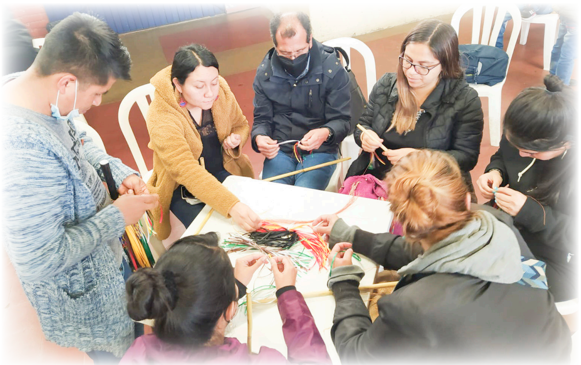
Imagen 21. Pueblo Eperãra Siapidarã, 2022. Elaboración de Bastones de Mando en la Estancia.