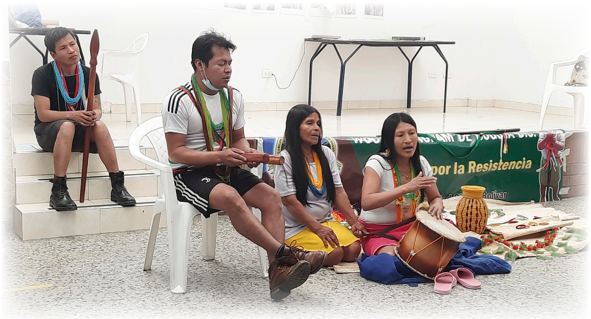
Imagen 13. Cárdenas, A. 2022. Ritual y baile de la Champita.

Todos los asistentes se pusieron de pie y bailaron en círculo junto con los hombres indígenas, las mujeres se ubicaron en el centro del espacio tocando el interior de la balsa de madera y cantando con una voz suave y constante. Finalizada esta danza inaugural, la Mayora y una mujer indígena joven se sentaron una junto a la otra en el piso, al lado de las artesanías sobre el fique. Allí iniciaron un canto en su lengua, acompañado de un tambor con sonido grave y constante, complementado por sonidos de golpes de madera seca y maciza.