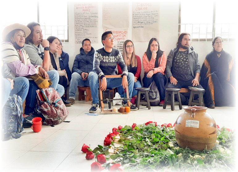
Imagen 36. Cárdenas, A. 2022. Tejido Pasto.