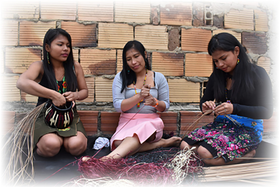
Imagen 11. Cabildo Wounaan, 2022. Indígenas wounaan tejiendo.

Lo cual, además de poner sus vidas en riesgo conlleva a una pérdida de varios elementos, costumbres, tradiciones de la cultura Wounaan, especialmente acelerado, por la interacción y asimilación constante de la cultura occidental. Según el censo 2018 su población nacional es de 14.825.