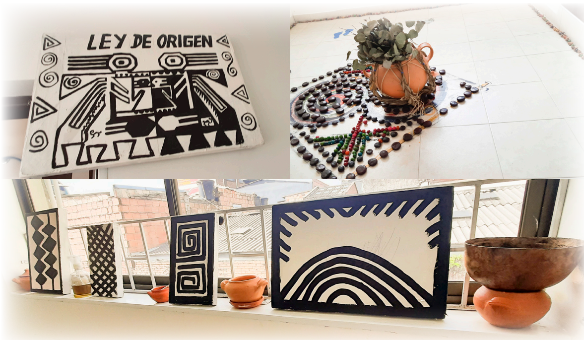
Imagen 32. Díaz, J. 2022. Salones Casita Payacua.