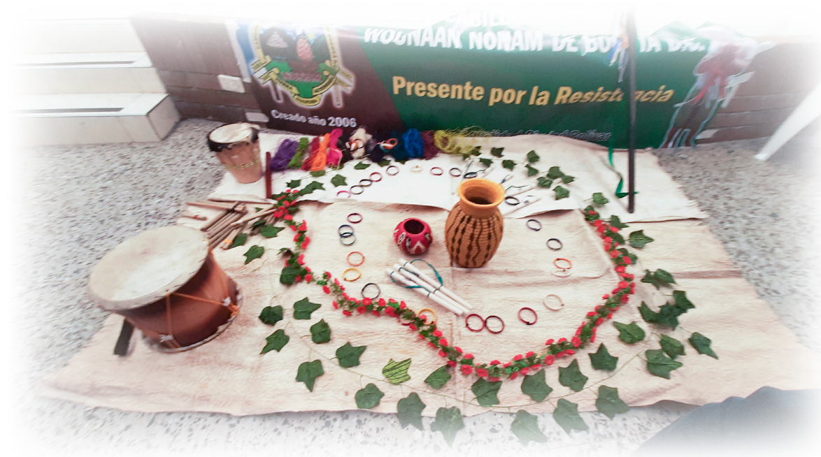
Imagen 12. Cárdenas, A. 2022. Ritual de Bienvenida.

En el fondo del salón comunal desplegaron cerca de 30 fotografías de tamaño carta donde se pueden apreciar algunas autoridades indígenas de diferentes procesos educativos y culturales, sobre el piso encima de una tela de fique muy clara, instalaron instrumentos musicales como quenenas, tambores y vasijas tejidas artesanalmente.