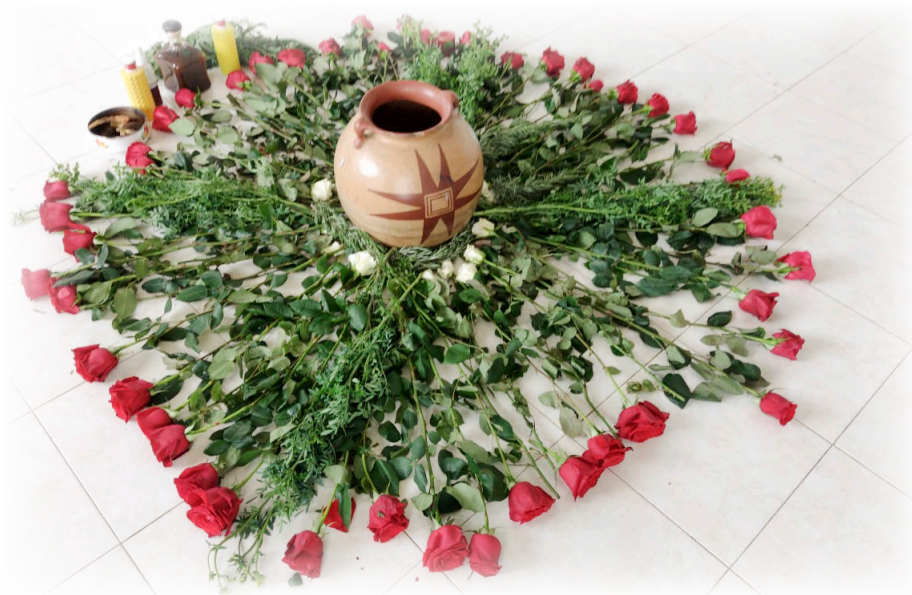
Imagen 31. Cárdenas, A. 2022, Escenario de Bienvenida.

En el fondo del salón, junto a una ventana se dispuso una mesa cubierta con una ruana, sobre ella las justicias, que son 6 bastones de madera de chonta, con figuras talladas con anillos de metal dorado a su alrededor, detrás de esta mesa se ubicaron las autoridades del cabildo. En el centro del espacio directamente sobre el piso se ubicó un altar, con una olla de barro en el centro, a su alrededor 50 rosas rojas y algunas rosas blancas, junto a ellas, las esencias y demás elementos para la armonización mental y espiritual.