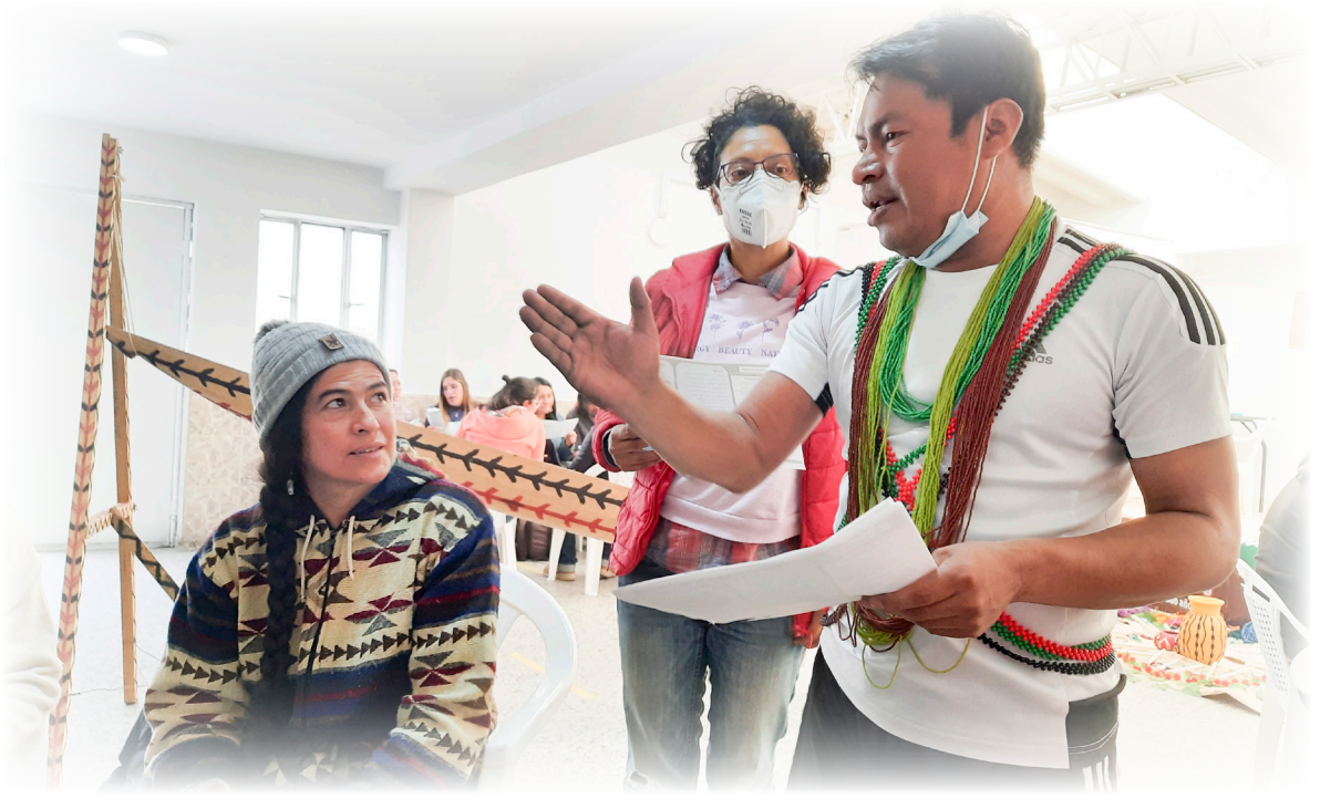
Imagen 15. Díaz.J 2022. Aprendiendo la Lengua Won Meu.