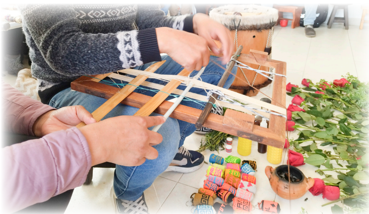
Imagen 33. Cárdenas, A. 2022. Tejido Pasto.