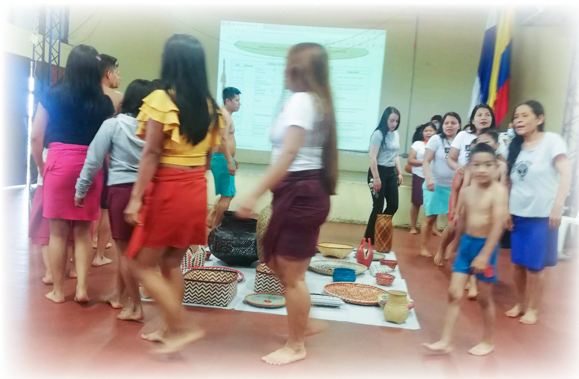
Imagen 18. Pueblo Eperãra Siapidarã. 2022. Ritual de Armonización.

Luego se realiza la presentación de cada uno de los asistentes a este encuentro como un ejercicio de reconocimiento, lo cual para el pueblo Eperãra, es importante desde el valor que viene de sus ancestros.