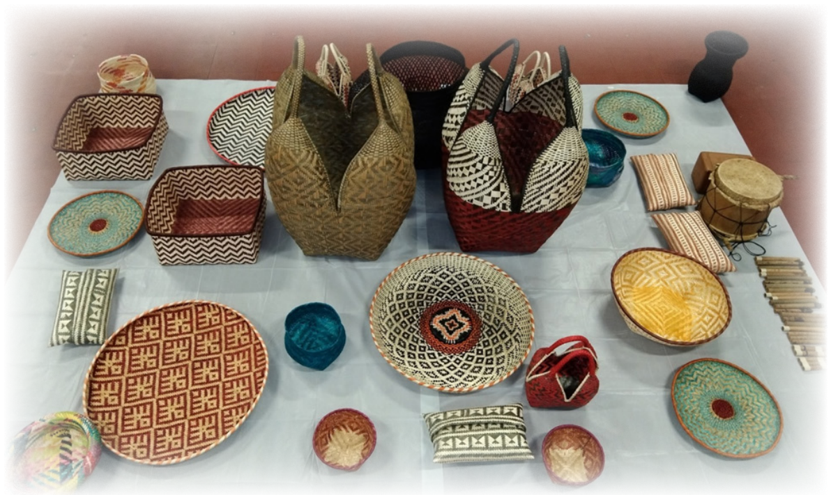
Imagen 17. Pueblo Eperãra Siapidarã. 2022 Utensilios de Tejido Propio.