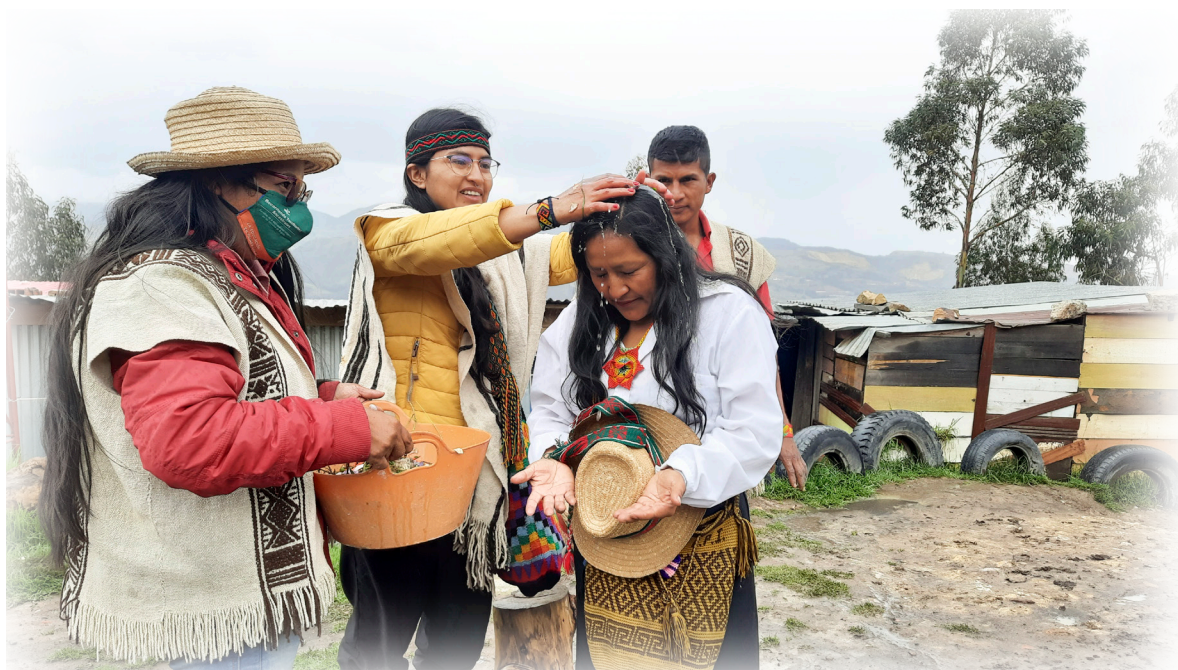
Imagen 5. Díaz.J 2022, Ritual de armonización.