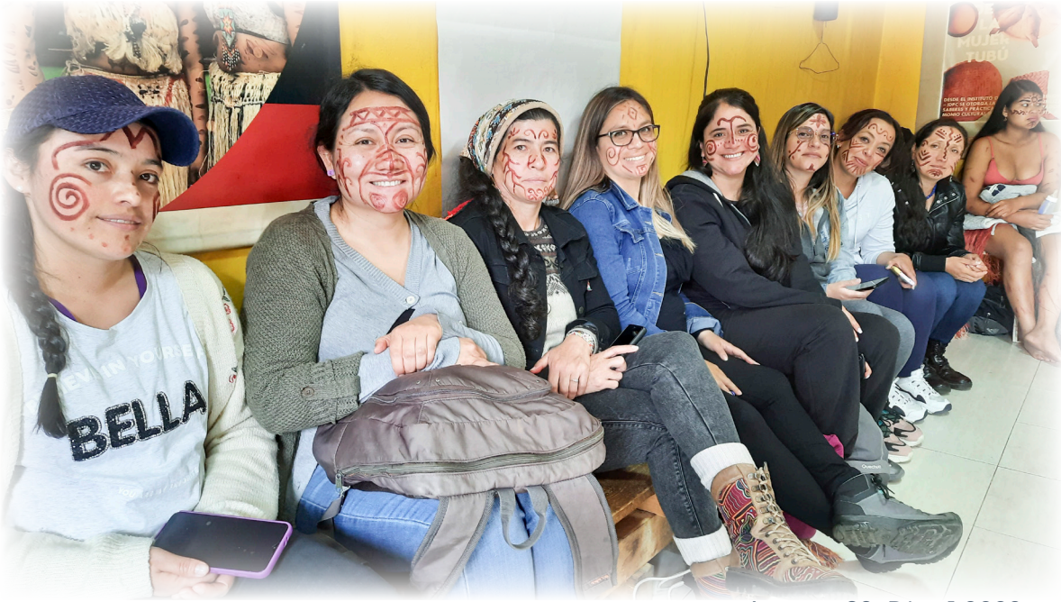
Imagen 29. Díaz.J 2022 Pintura Corporal con Símbolos Propios.