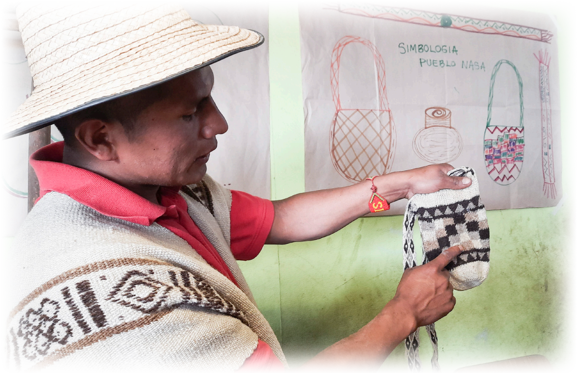
Imagen 7. Díaz.J 2022, Tejido Nasa.

Por ejemplo, la Jigra es una mochila de cabuya que teje la mujer, representa la matriz generadora de vida. En ella antiguamente en el territorio se guardaban las semillas para protegerlas de los roedores. Se guardaban las semillas y se anudaban, luego se metía una mochila entre otra y otra hasta que quedara inaccesible. Así cuando los roedores trataban de llegar a las semillas se cansaban de roer y roer cabuya sin llegar al anhelado tesoro.