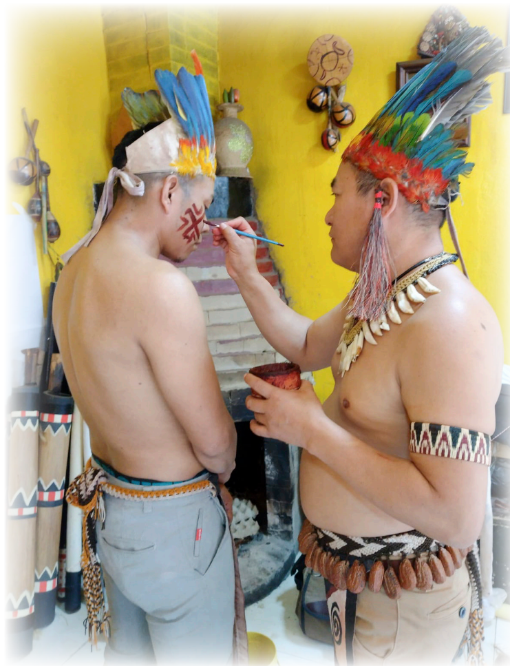
Imagen 25. Pueblo Tubú.2022. Pintura Corporal con Símbolos Propios.