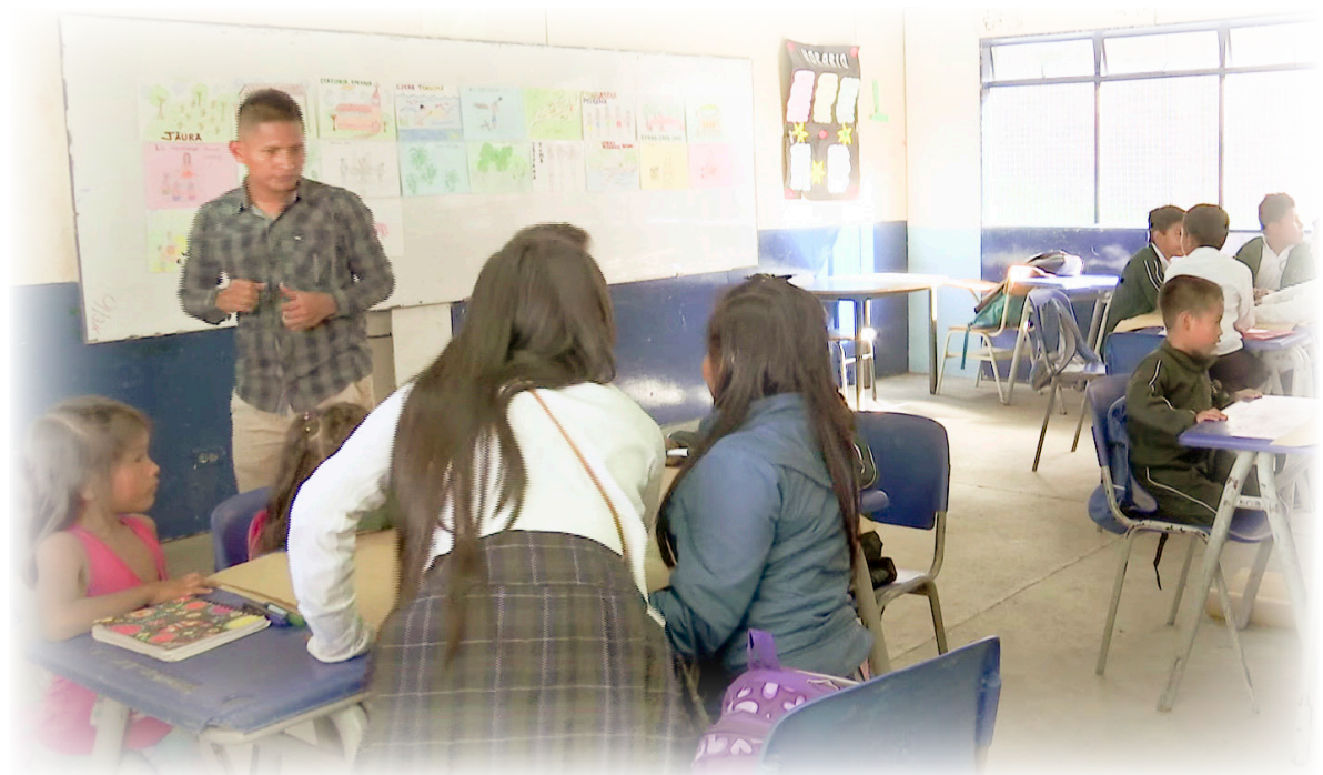
Imagen 19. Pueblo Eperãra Siapidarã. 2022