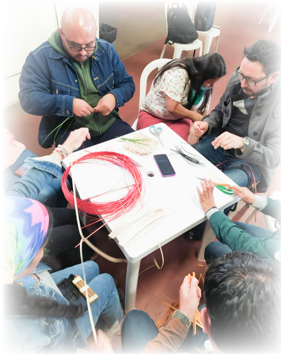
Imagen 20. Pueblo Eperãra Siapidarã 2022. Tejido de canastos en la Estancia.

Se organizan tres grupos en los cuales se desarrollan tres prácticas de la cultura Eperãra: Tejido de canastos, elaboración de bastones de mando y enseñanza de la lengua Siapedee