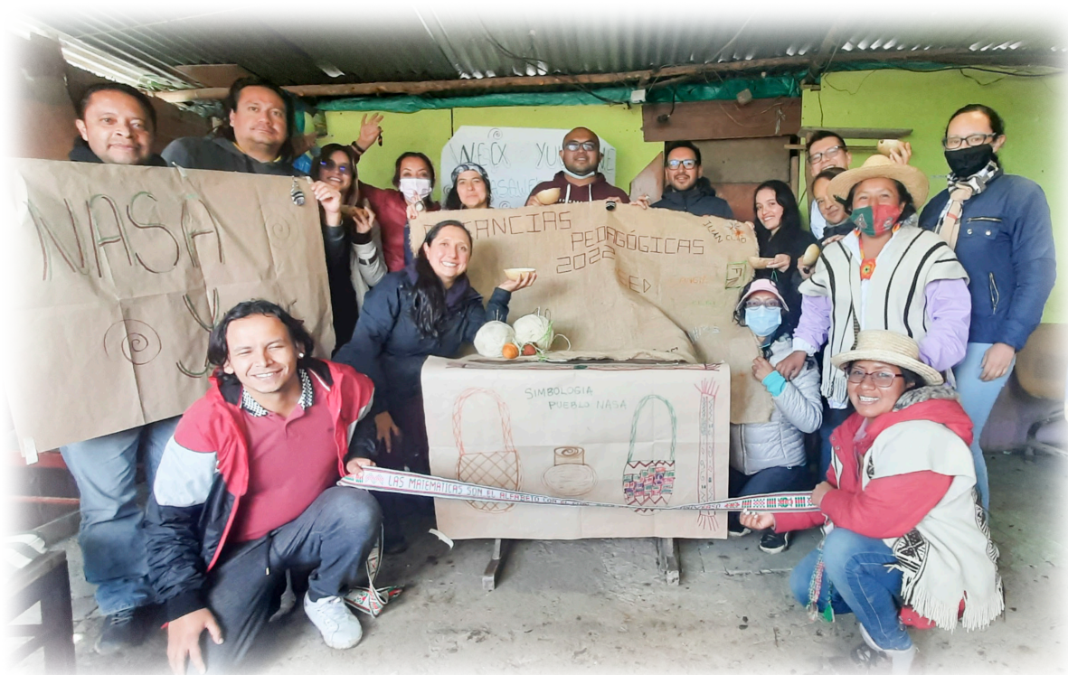
Imagen 9. Díaz, J. 2022 Cerrando el encuentro.

Luego de compartir el alimento propio en el almuerzo, se invita a todos y todas las maestras participantes a dejar plasmada su huella a través de un trabajo colectivo que consiste en hacer un bordado propio como huella de este camino que inicia y que se finalizará al terminar la visita por los otros cabildos, como resultado tenemos un mural en tela yute tejido en lana de oveja que queda expuesto en la casa indígena. Aquí el bordado muestra la personalidad de cada uno de los maestros.