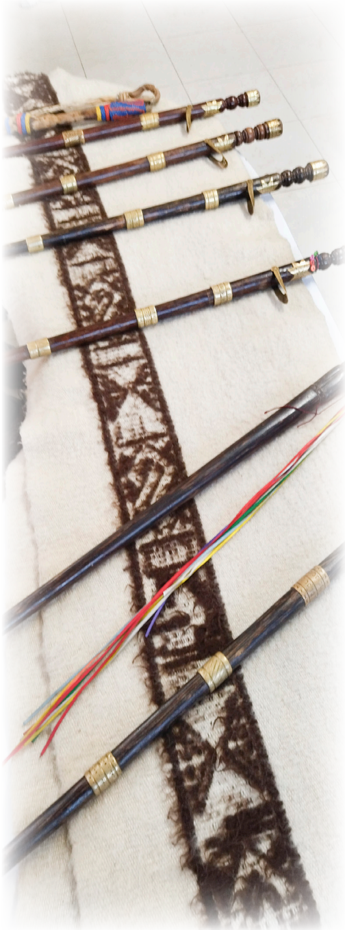
Imagen 35. Cárdenas, A. 2022. Tejido Pasto.