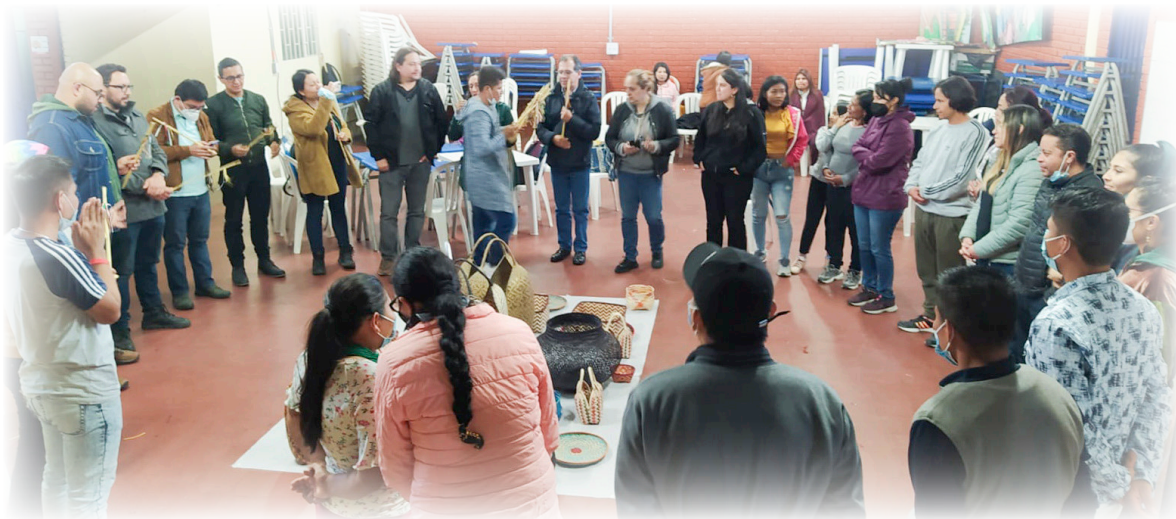
Imagen 22. Pueblo Eperãra Siapidarã. 2022. Ritual de Despedida.

Se hace un círculo de agradecimiento, en el cual se repiten palabras en lengua SiaPedee para honrar este espacio.