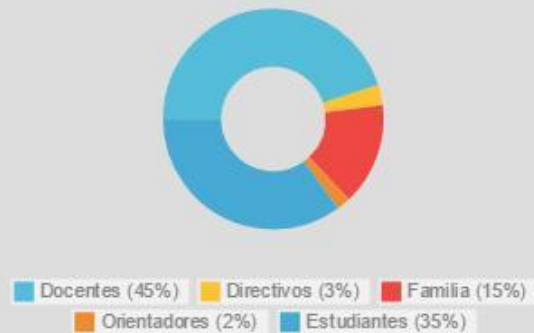
Facilitadores por Estamento

En un momento inicial el equipo dinamizador se constituyó por docentes de la jornada mañana y tarde, de primaria y bachillerato, que lideraran proyectos principalmente 40x40, convocados para ello por el rector de la Institución, pero tal equipo no logró consolidarse. Ocurrido esto, otros docentes decidieron tomar el proceso: una docente de primaria de la jornada mañana, una docente de primera infancia y uno de bachillerato, jornada tarde, dos docentes de media técnica en ambas jornadas. Este equipo similar a lo que ocurriera con el anterior, ha funcionado con dificultad, y actualmente sólo cuenta con la participación de tres docentes, aunque se ha fortalecido en gran manera con la participación activa de un grupo de 15 estudiantes de diferentes grados y un grupo significativo de padres y madres de familia, pertenecientes a una propuesta 40x40, y la participación esporádica de estudiantes de la línea técnica ambiental.